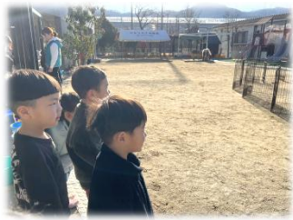
モルモット、かわいい♡