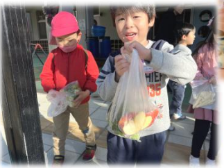
たくさん食べてね！