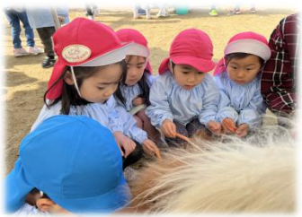
ヤギの角、すごい硬い！！