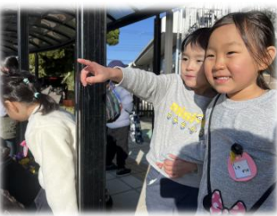
ウサギ抱っこできたよ！

3学期始まってからずっと楽しみにしていた子ども動物園！「去年いた黒豚が怖かった、、、今年も来るのかな？」と心配する声がたくさん聞こえてきました(笑)当日、実際に動物を見ると「少しだけいけるかも！」「ごはんあげてみようかな、、、」と勇気を振り絞っている姿がありました。終わってからは、「来年楽しみ♪早くこひつじになりたい〜」という子も！こうさぎの時は涙を流し過ぎた子が多かったですが、一年の成長をとでも感じられた1日になりました！ 見て見て！動物さん入ってきた〜！！ お馬さんの毛、ふわふわや！